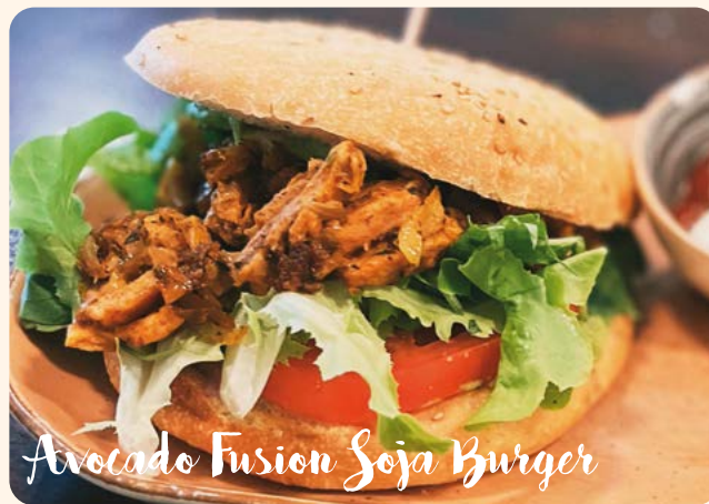
Avocado Fusion Soja Burger

Plant based Soja-Chunks | Zwiebeln | Tomaten | Gurken | Salatherzen | Guacamole | wahlweise mit gebackenen Kartoffeln, Pommes Frites oder einer Salatschüssel | Dip nach Wahl BBQ, Ketchup oder Guacamole