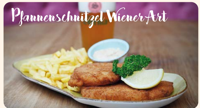
Pfannenschnitzel Wiener Art

PIKANTE CURRYWURST „NEW YORK“ 10,50 180 g Bockwurst | fruchtige - Currysauce | Röstzwiebeln | Pommes Frites