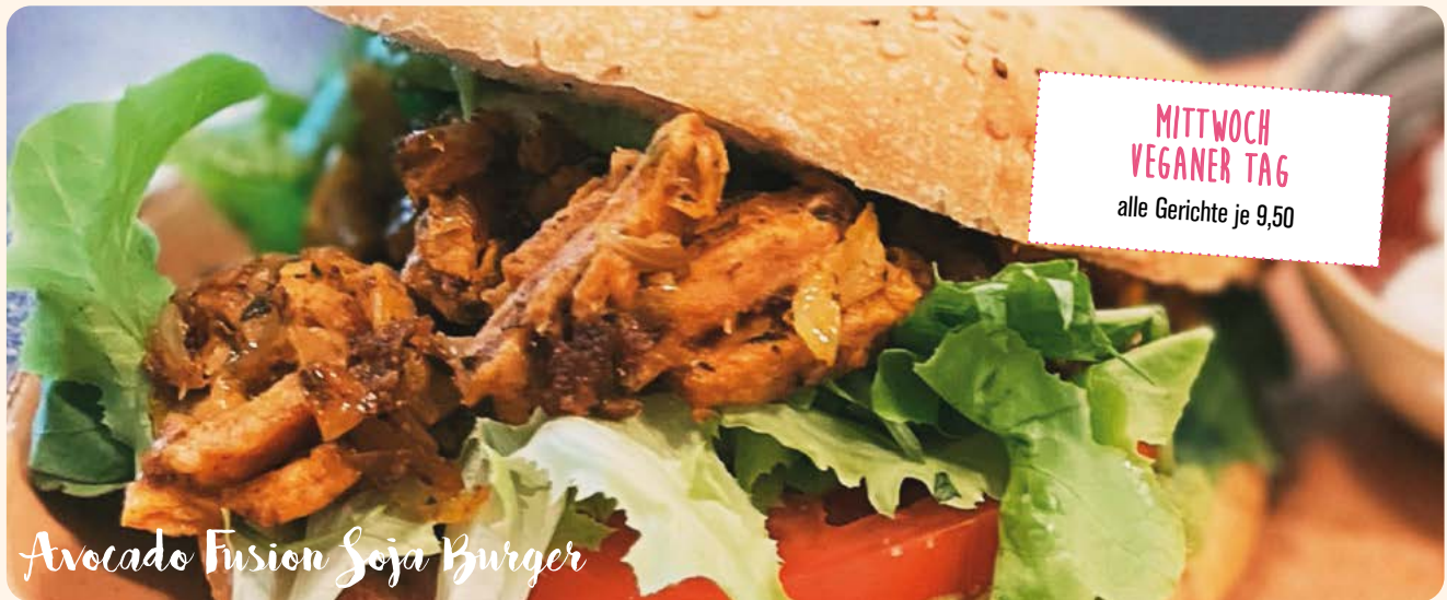
Avocado Fusion Soja Burger

Wir servieren unsere Burger wahlweise mit gebackenen Kartoffeln, Pommes Frites, Süßkartoffelpommes (Aufpreis 2,-) oder einer Salatschüssel. Dips nach Wahl Aioli oder Rot/Weiss